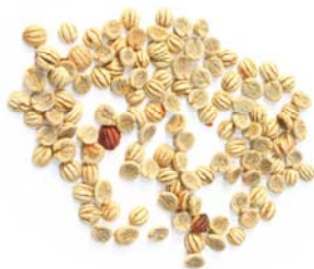
Psychotria viridis zaden