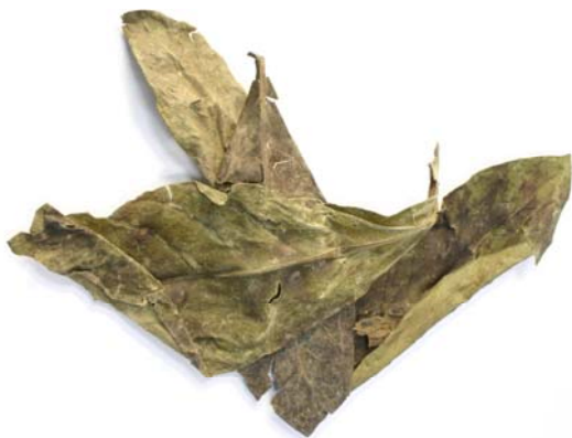
Psychotria viridis bladeren Spirit Elixir bevat een visionaire verbinding die elk zoogdier en veel planten produceren.