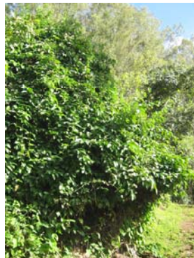
Banisteriopsis caapi struik

Het is verstandig om de waarschuwingen goed door te nemen. Tripverslagen onthullen dat dit brouwsel lichamelijke en geestelijke gevaren meebrengt voor degenen die de inheemse of westerse kennis over sjamanistische bezigheden negeren. Degenen die dat niet negeren staan op het punt aan boord te gaan van een mystiek avontuur met een buitengewoon helende, rijke, vitaliserende en ontroerende kwaliteit.